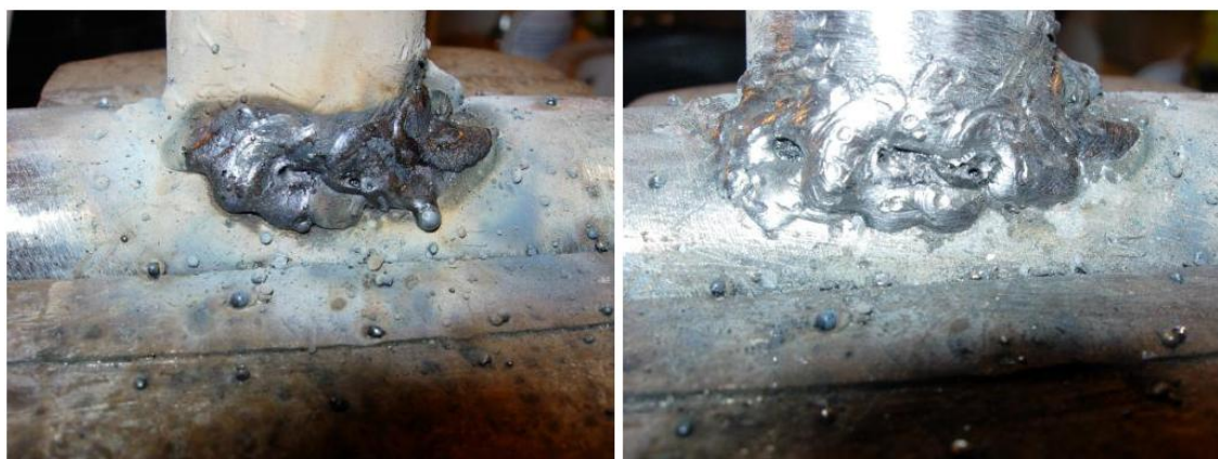
Figure 4 : Soudure MAL réalisée. A gauche, avec laitier. A droite, une fois le laitier retiré.