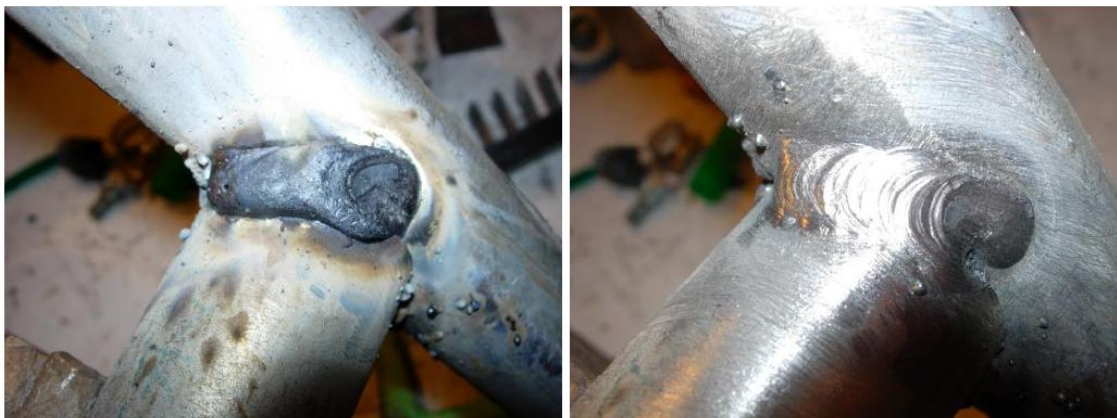
Figure 3 : Soudure BIEN réalisée. A gauche, avec laitier. A droite, une fois le laitier retiré.